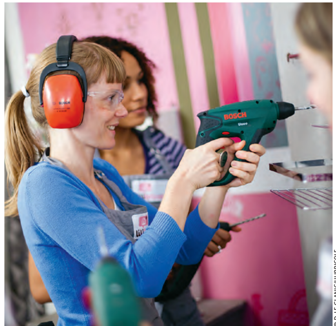
Les ateliers sont ouverts aux novices et aux confirmés qui souhaitent se perfectionner.

Infos pratiques et inscriptions sur lebhvmarais.fr ou lilibricole.com , LE BHV MARAIS, Paris 4 e .