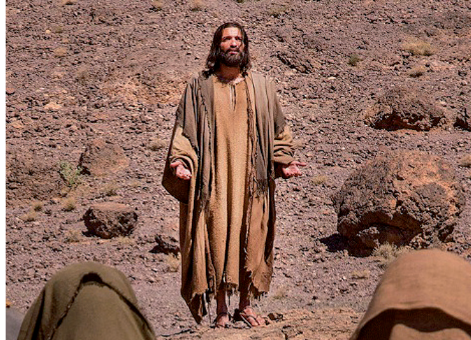
Cette œuvre en deux parties raconte l'histoire de Jésus de sa naissance à sa mort.