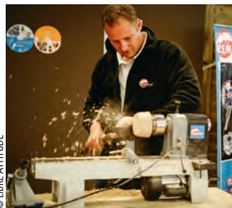
Des artisans à l'œuvre à Foire de Paris.

Foire de Paris offre à ses visiteurs l'opportunité de discuter sur les problématiques du quotidien. L'événement, qui se tient jusqu'à dimanche à la Porte de Versailles, à Paris, permet de profiter de nombreux conseils utiles et