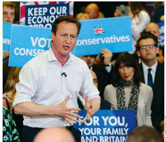
Le Premier ministre a mené campagne jusqu'au bout pour mobiliser les Britanniques.

«La décision la plus importante d'une génération.» Hier, au dernier jour de campagne électorale, David Cameron a mis la pression aux Britanniques. Aujourd'hui, ils seront des millions à voter pour des législatives qui s'annoncent très serrées. Selon un dernier sondage publié par le Sun , les conservateurs du Premier ministre sortant sont au coude à coude avec leurs rivaux travaillistes, menés par Ed Miliband (33 % des voix chacun). Un score qui ne permettrait pas au vainqueur de décrocher la majorité absolue à la Chambre des communes. Dans ce cas, des négociations auraient lieu avec les partis plus petits, notamment les libéraux-démocrates de Nick Clegg, afin de former une coalition. Pour éviter ce scénario, Cameron et Miliband ont fait campagne jusqu'au dernier moment. Le premier en avançant «le chaos» d'un changement de gouvernement, le second en pointant les «promesses non tenues» des conservateurs. •