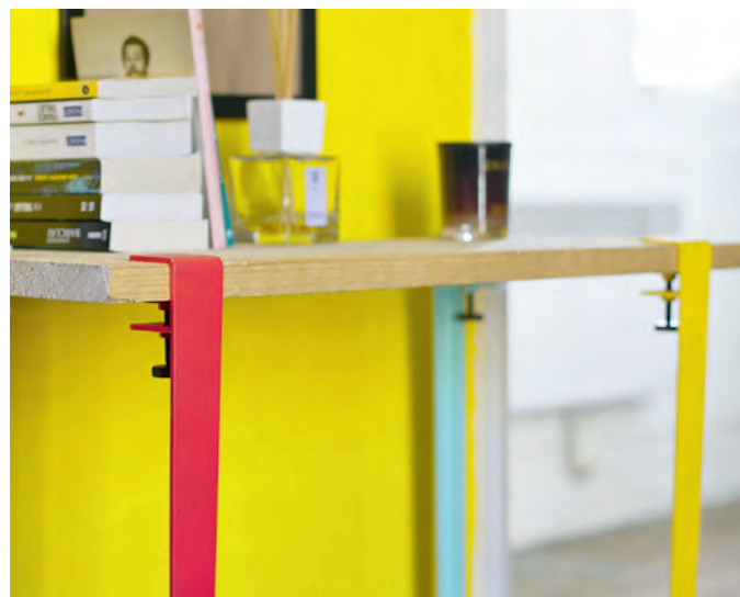
Les quatre pieds s'adaptent à n'importe quelle planche pour créer consoles ou tables.

Jeu de quatre pieds de 40 cm de hauteur, 99 € au lieu de 119 €, soit -15 %. Jeu de quatre pieds de 75 cm de hauteur, 116 € au lieu de 136 €, soit -15 %. Présent à Foire de Paris, pavillon 4, stand E022. www.tiptoe.fr