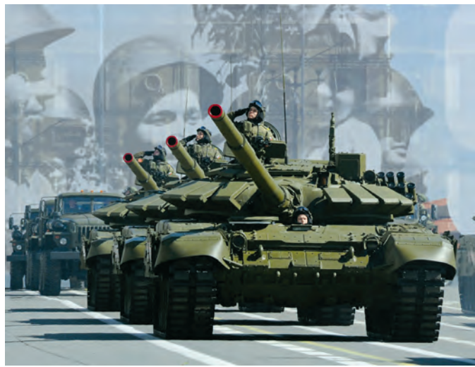
Plus de 194 unités blindées défilent dans le centre de Moscou et sur la place Rouge.

Comme le veut la tradition, François Hollande ravivera la flamme qui orne la tombe du soldat inconnu, sous l'Arc de Triomphe, à Paris, avant de déposer une gerbe au pied de la statue du général de Gaulle, place Clemenceau. Le président de la République réunira également les survivants de la génération 39-45, à qui il remettra la Légion d'honneur. Des cérémonies auront également lieu un peu partout en France. A Lyon, capitale de la résistance, une «cérémonie de la paix» se tiendra ainsi sur la place Bellecour, en présence du consul général d'Allemagne, Klaus Ranner. Le public pourra écouter une interprétation de l'Ode à la joie et la lecture, par des lycéens, de textes de Robert Schuman.