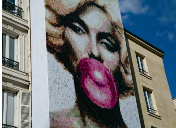
Cette création, représentant Marilyn Monroe, a été installée au 384, rue Saint-Honoré.

Le choix de représenter Marilyn Monroe n'est pas anodin. «C'est un symbole de beauté universel. Le défi était de réaliser cette image en y mettant de la diversité, avec des portraits de femmes de différentes origines, corpulences, des jeunes et des moins