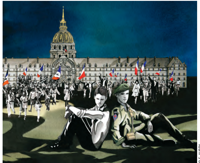
Ami, entends-tu ? met en lumière de jeunes résistants prêts à mourir pour la liberté.