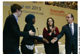
François Hollande, hier à Paris.

Pour fêter ses trois ans à l'Élysée, il a misé sur ceux qui étaient sa priorité pendant sa campagne. François Hollande s'est rendu hier au Conseil économique, social et environnemental (Cese) pour y rencontrer huit jeunes âgés de 20 à 25 ans et débattre sur l'éducation, l'emploi ou encore l'engagement associatif. Rappelant notamment son objectif de développer le service civique, le chef de l'État en a également profité pour annoncer un train de mesures en faveur de la jeunesse. L'année de césure sera ainsi introduite à l'université «dès cette année» et la Journée défense et citoyenneté devrait être refondue. •