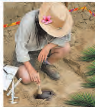
Incredible découverte d'un trésor martiniquais.

* Valable pour vol + hôtel + activités. Règlement du jeu consultable sur simple demande auprès de la Maison de Martinique ou sur le stand de la Foire de Paris 2015.