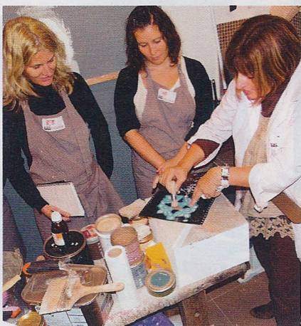
La technique du pochoir doit être maîtrisée, car elle est souvent employée pour relooker les vieux meubles.