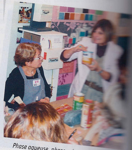
Phase aqueuse, phase solvantée : l'usage des peintures nécessite des explications.