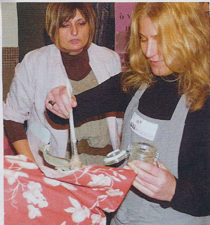
Souvent incontournable : le décapage chimique d'une ancienne peinture sur un meuble.