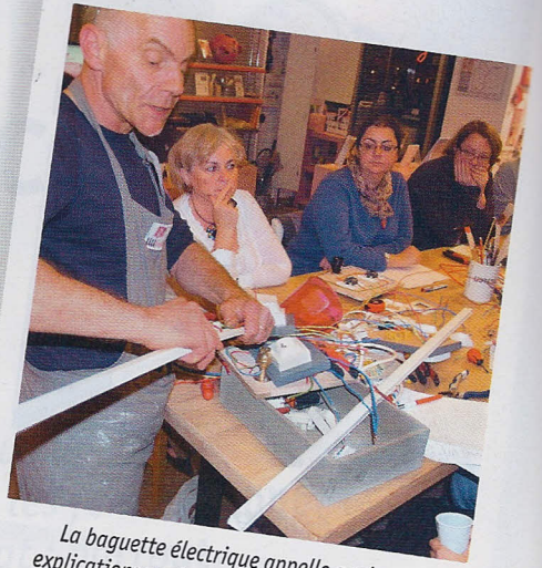
La baguette électrique appelle quelques explications sur les normes et son utilisation.