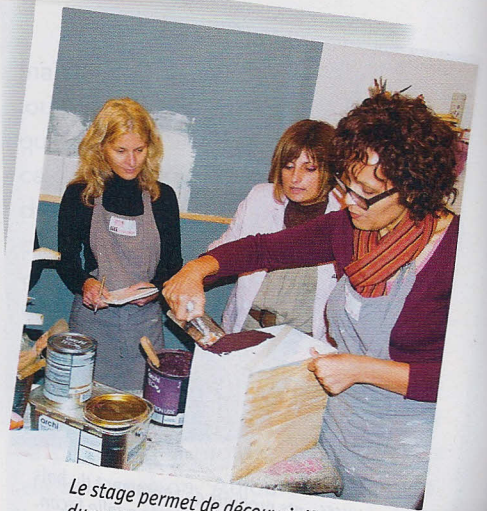
Le stage permet de découvrir l'usage du couteau à enduire en décoration.